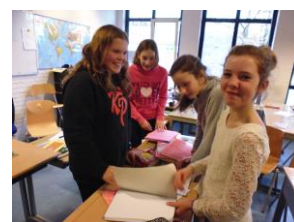
Terugkommiddag vorig schooljaar

We gaan ervan uit dat dit weer een waardevolle middag wordt die de kinderen uit groep 8 helpt om de overstap naar het voortgezet onderwijs makkelijker te maken.